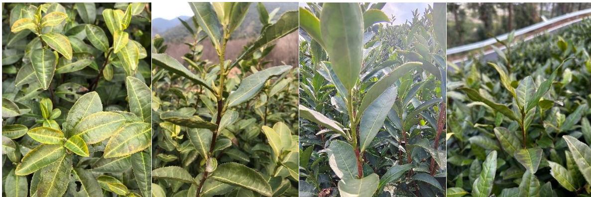
德清龙井 43 (2.25) 长兴嘉茗一号 (2.28) 吴兴龙井 43 (2.28) 安吉安吉白茶 (2.28)

据湖州城市气象站资料统计，2025年1月1日至3月4日平均气温为6.4℃，比常年高1.2℃，比上年高0.6℃；极端最高气温为31.6℃（3月2日），极端最低气温为-5.9℃（2月8日）；雨量为61.0毫米，比常年少120.0毫米，比上年少184.1毫米；雨日为15天，比常年少9.9天，比上年少12天；日照为337.5小时，比常年多98.6小时，比上年多79.5小时。